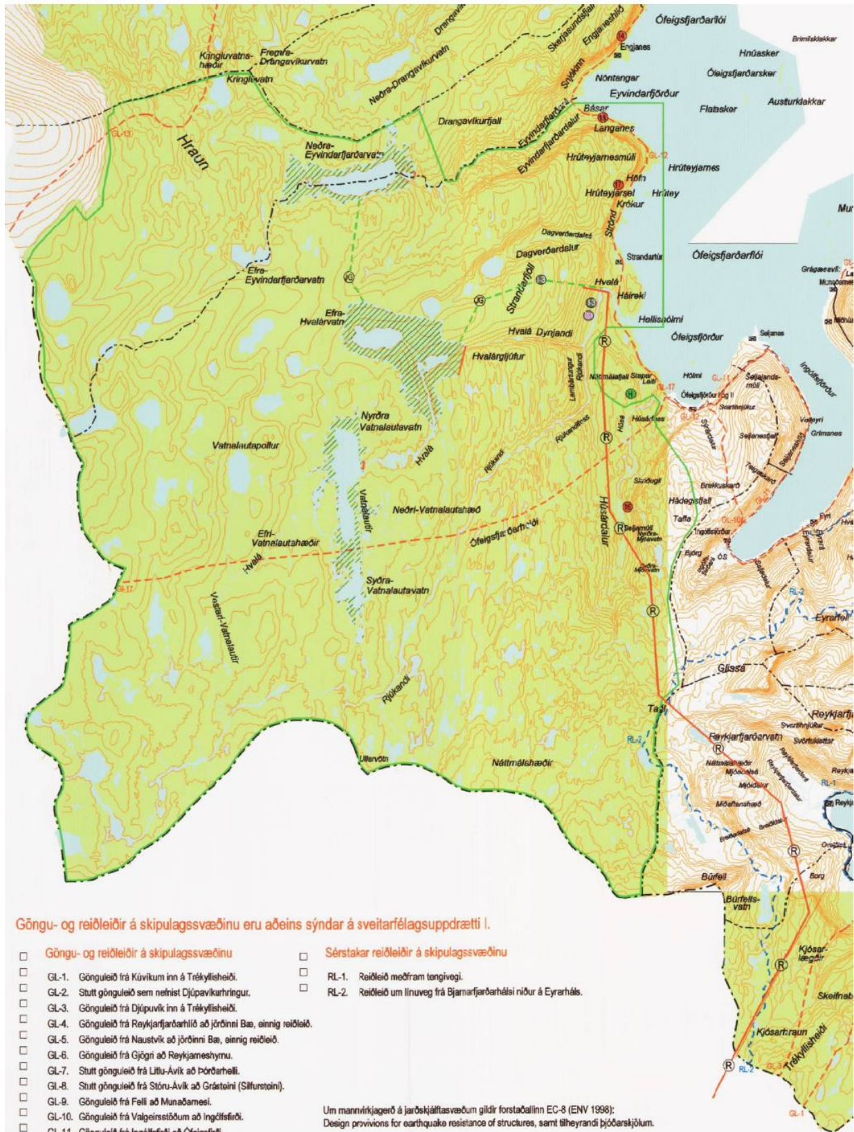
Mynd 1.1 Aðalskipulag Árneshrepps 2005-2025 – hluti sveitarfélagsuppdráttar I. Virkjunarsvæði Hvalár er afmarkað með grænni heilli línu. Hvalárlína er sýnd með rauðri R-merktri línu. Skýringar eru á næstu síðu.